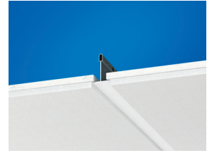
Фрагмент системы Gedina E