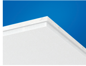
Панель Gedina E