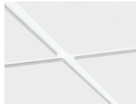
Система Gedina E