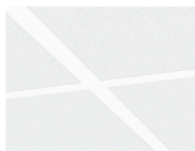
Система Gedina A